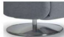
Tellerfuß* Metall Alu gebürstet, silber matt