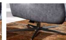
Kreuzfuß* Metall schwarz matt

Der Tellerfuß* ist optional auch in Stoff- oder Lederbezug erhältlich