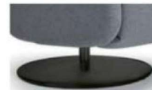
Tellerfuß* Metall pulverbeschichtet, schwarz matt