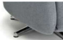
Sternfuß Metall Alu poliert, silber glänzend