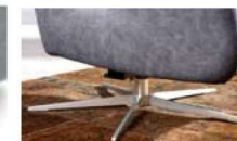
Kreuzfuß* Metall silber matt