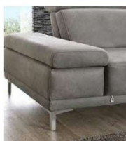
AT fest (Standard)