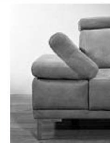
AT klappbar (Aufpreis)