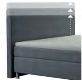
0300 Multimaß Höhe 80 - 125 cm in 5cm-Schritten kürzbar gegen Aufpreis