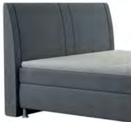
0050 Höhe 117 cm Standard