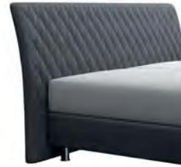
0354 Höhe 116 cm gegen Aufpreis