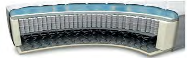
MA760GA gegen Aufpreis