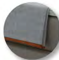
Typ 100 Plaid Klassik Kanten mit Einfassband paspeliert