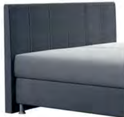
0320 Höhe 115 cm gegen Aufpreis