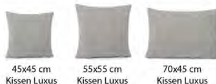
45x45 cm Kissen Luxus