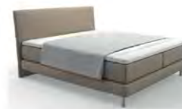
Typ 100 Plaid Klassik komplett geöffnet deckt die Liegefläche nicht ab.