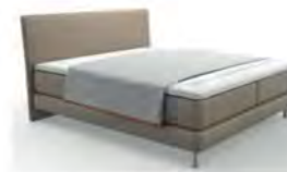
Typ 100 Plaid Klassik komplett geöffnet deckt die Liegefläche nicht ab.

Bitte bei Bestellung (vor allem Einzel- oder Nachbestellung) immer die Bettmaße angeben. Die angegebenen Maße sind ca. Maße. Geringfügige Maßabweichungen zur Liegefläche plus Volanthöhe sind produktionsbedingt