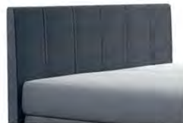
0320 Höhe 115 cm Standard