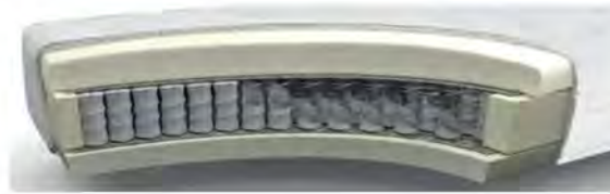
MA235VA gegen Aufpreis