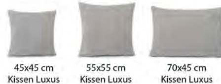
45x45 cm Kissen Luxus