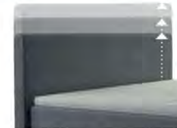
0300 Multimaß Höhe 80 - 125 cm in 5cm-Schritten kürzbar gegen Aufpreis