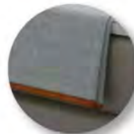
Typ 100 Plaid Klassik Kanten mit Einfassband paspeliert