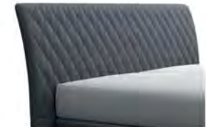
0354 Höhe 116 cm gegen Aufpreis