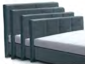
→ 0998S - Höhe 99 cm → 0998M - Höhe 109 cm → 0998L - Höhe 119 cm → 0998XL - Höhe 129 cm gegen Aufpreis