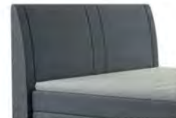
0050 Höhe 117 cm gegen Aufpreis