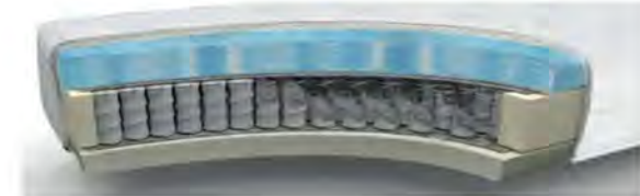
MA235GA gegen Aufpreis